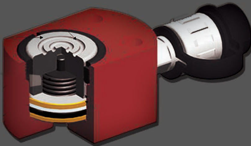
FLAT CYLINDER FROM 5TON TO 100TON